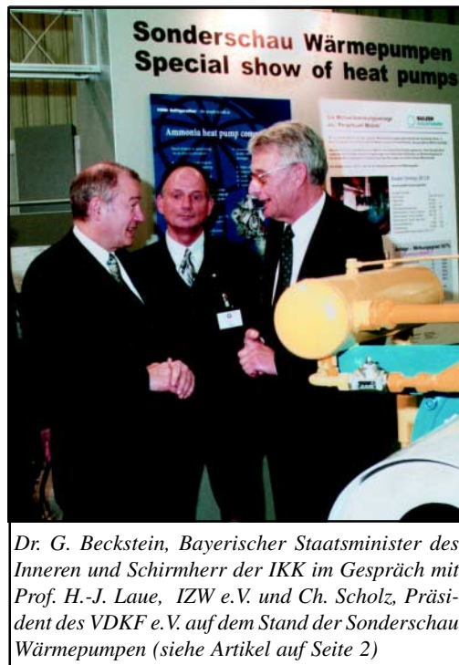
Dr. G. Beckstein, Bayerischer Staatsminister des Inneren und Schirmherr der IKK im Gespräch mit Prof. H.-J. Laue, IZW e.V. und Ch. Scholz, Präsident des VDKF e.V. auf dem Stand der Sonderschau Wärmepumpen (siehe Artikel auf Seite 2)

Selbstverständlich bekommt man damit ein Ergebnis das ungünstig für Wärmepumpen ist. Alle 20 getesteten Wärmepumpen sind danach in Hinblick auf die CO 2 -Emissionen schlechter als die Gas-Brenn-