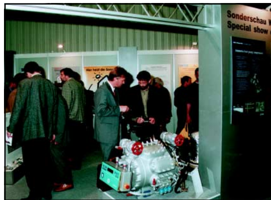
Das reichhaltige Ausstellungsangebot der Sonderschau wurde von zahlreichen Messebesuchern in Anspruch genommen

In der Ausstellung konnten sich die Besucher an Hand von Postern und Exponaten über das breite Spektrum möglicher Wärmepumpenanwendungen in der Gebäudetechnik, in Gewerbe und Industrie informieren. Zahlreiche Aussteller präsentierten ausgewählte Exponate und zeigten auf Postern neueste Innovationen aus dem Bereich der Wärmepumpentechnik. Neben weiterentwickelten Komponenten wurden erfolgreiche Wärmepumpenprojekte, z.B. zur Nutzung industrieller Abwärme, vorgestellt.