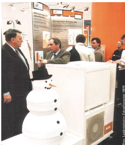
Wärmepumpen-Marktplatz NRW auf der E-world of energy

Diese Institution wird getragen von vier Landesministerien -Wirtschaft, Städtebau, Wissenschaft und Umwelt, das ist einmalig in Deutschland und gleichzeitig ein Zeichen breiter politischer Unterstützung. In 15 Arbeitsgruppen arbeiten mehr als 3.000 Experten aktiv mit, um das „EnergieLand“ Nordrhein-Westfalen, Schwerpunkt der Energiebranche in Europa, für die Entwicklung und Nutzung zukunftsfähiger Energietechnologien stark zu machen.